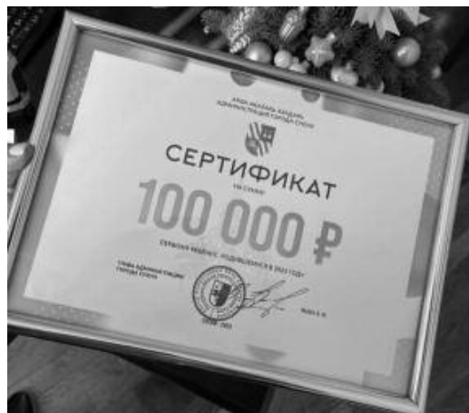
Первый ребёнок, ро-