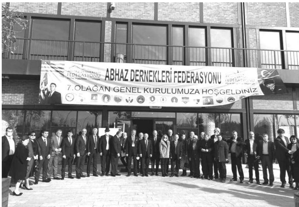
Эшба и Папба.

Состоялся ряд встреч в Стамбуле и Анкаре, в том числе и с депутатами Парламента Турции – абхазами