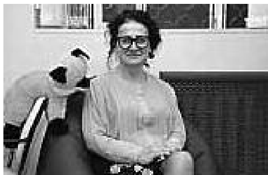
Революционность Абхазии, размышления очевидца