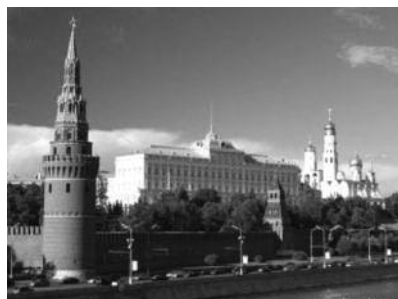
Президент Российской Федерации Владимир

Путин направил телеграмму Президенту Республики Абхазия Раулю Хаджимбе с приглашением принять участие в торжественных мероприятиях по случаю 75-й годовщины Победы в Великой Отечественной войне.